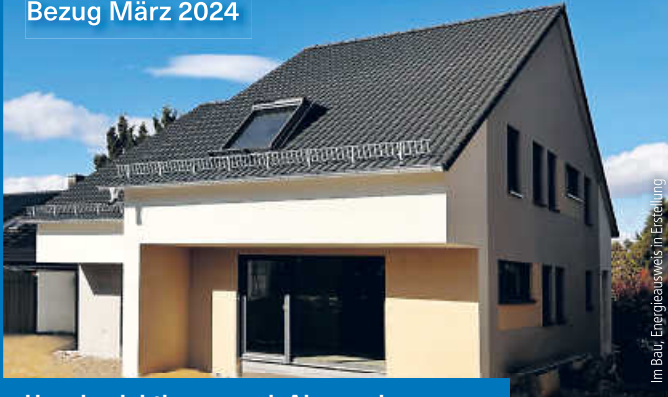
Im Bau, Energieausweis in Erstellung

Hausbesichtigung nach Absprache. Wir freuen uns auf Ihre Kontaktaufnahme.