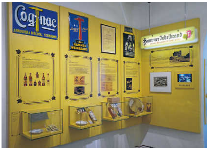
Schwäbisches Schnapsmuseum – Ausstellungsabteilung zur Geschichte der Hammer Brennerei (ehem. Heilbronn)