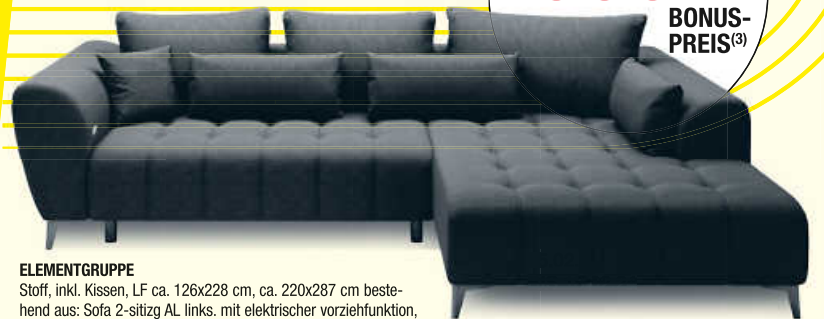
ELEMENTGRUPPE Stoff, inkl. Kissen, LF ca. 126x228 cm, ca. 220x287 cm beste- hend aus: Sofa 2-sitzig AL links, mit elektrischer vorziehfunktion, Ottomane AL re. Normalpreis 2.426.- Bonus-Preis 999.-. 208238

Freie Möbelschau von 11 – 13 Uhr Beratung & Verkauf von 13 – 18 Uhr